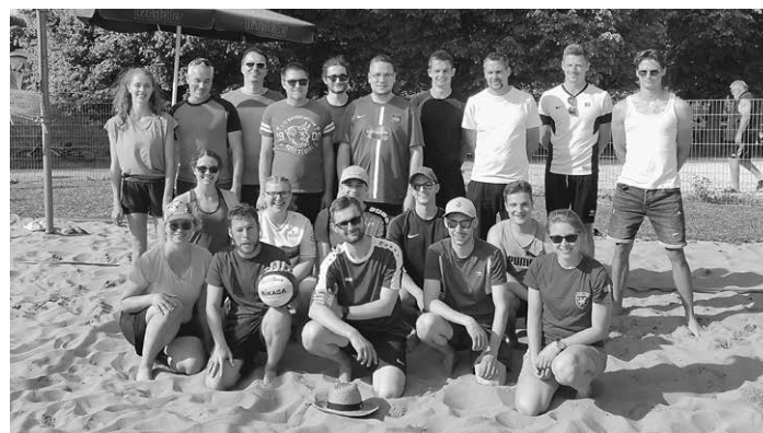
Alle Teilnehmer des Beach-Turniers

Ein großer Dank gilt den zahlreichen Helfern im Hintergrund!