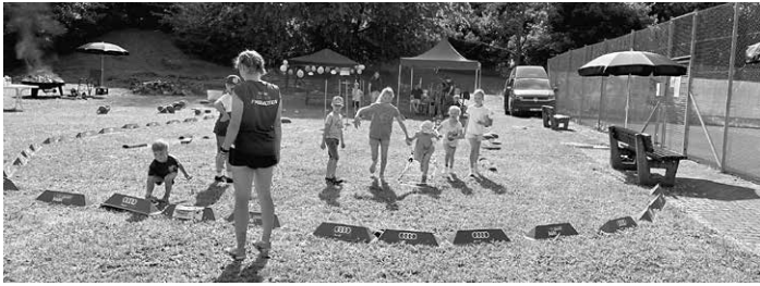
Die Kleinsten erfreuten sich am Bewegungsmobil des Skiverbandes!