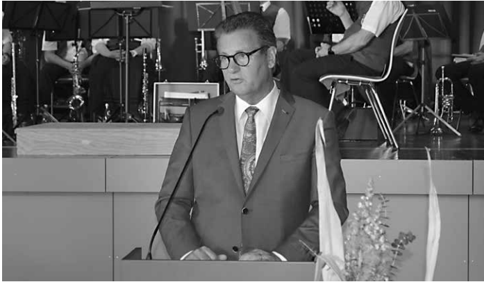
Minister Peter Hauk, MdL Minister für Ernährung, Ländlichen Raum und Verbraucherschutz Baden-Württemberg